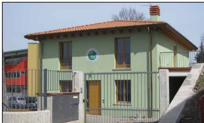
La sede degli Alpini in via Pellegrino Montichiari.