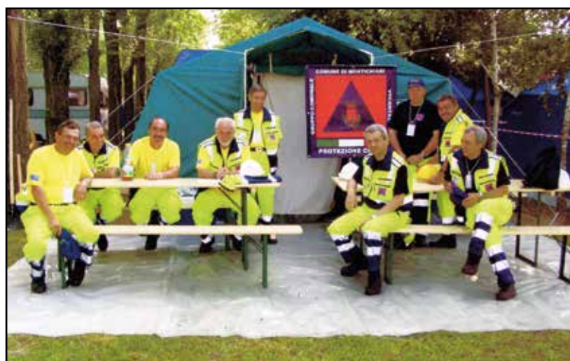
Alcuni dei volontari facenti parte del gruppo comunale di Protezione Civile.

Un intervento particolare per il recente terremoto in Albania con la raccolta di generi alimentari, presso il supermercato Famila, e di numerosi indumenti