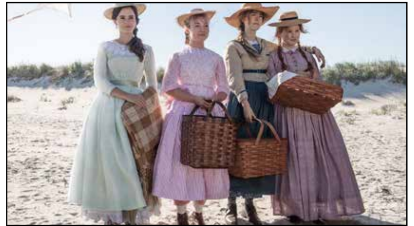
Le piccole donne protagoniste del film.

Con un sapiente alternarsi di flashback, annunciati soltanto dal cambio delle tonalità di colore della scena, il film riesce a rendere giustizia alle quattro ragazze March in tutta la loro determinazione, unione e unicità. Sebbene la protagonista indiscussa sia Jo, scrittrice e "maschiaccio" della famiglia, a tutte le sorelle viene dedicato il giusto spazio per conoscerne i sogni e le paure.