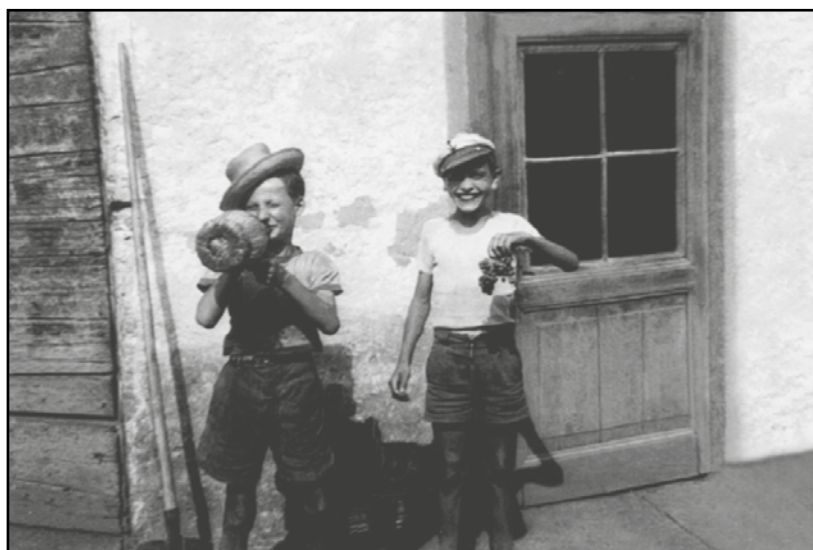
Chi li riconosce?

di una cascina. Un incontro che si è svolto nella frazione di S. Antonio ben 65 anni fa. Il nostro lettore cerca una conferma dell'identità dei due ragazzini, ora avanti con l'età.